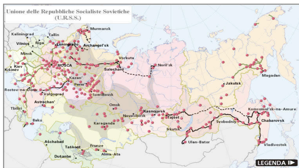
Cartina tratta da Gulag - Italia

Con la Rivoluzione bolscevica del 1917 la Russia passa sotto il controllo comunista. Negli anni '20 inizia la politica del terrore che caratterizza sia il periodo leniniano che quello staliniano: nasce il Sistema Gulag. Si calcola che all'interno dei lager sovietici disseminati nei luoghi più inospitali, siano passate dai 15 ai 20 milioni di persone. Il regime instaurato in URSS presentava le caratteristiche di un sistema totalitario, col potere nelle mani del partito comunista che si identificava con lo Stato usando l'ideologia come strumento di dominio sulla società. Il controllo dei mezzi di comunicazione e l'onnipotente polizia segreta paralizzavano la popolazione disseminando terrore e soffocando ogni forma di dissenso. Era in questo clima che Vasilij Grossman scrisse le sue opere.